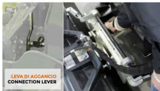
LEVA DI AGGANCIO CONNECTION LEVER

RoboEVO è una macchina porta-attrezzi radiocomandata dotata di un sollevatore dedicato che prevede un sistema di sostituzione rapida dell'attrezzatura, facilitando l'operatore e rendendo il suo lavoro più piacevole e multifunzionale. Sollevatore e attacchi idraulici permettono il perfetto accoppiamento con tutte le attuali e precedenti attrezzature di casa Energreen.