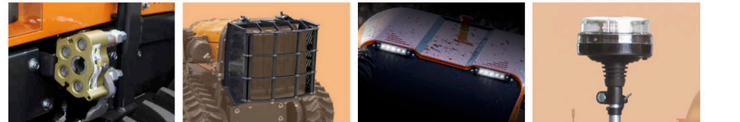
Attacchi rapidi (CEJN) Hydraulic couplings (CEJN)