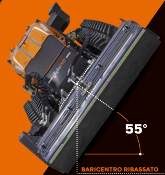
BARICENTRO RIBASSATO LOWERED CENTER OF GRAVITY