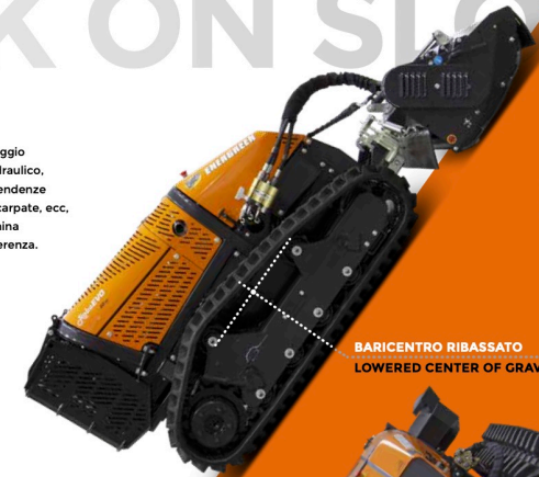
BARICENTRO RIBASSATO LOWERED CENTER OF GRAVITY

The new tracks profile allows a larger ground contact surface of the machine; the hydraulic tensioning system make RoboEVO a safe machine for working on slopes up to 55° in all directions: hill and mountain areas, embankments, cliffs, etc. and in all those environments where the adherence is very low and a machine for high slopes is required.