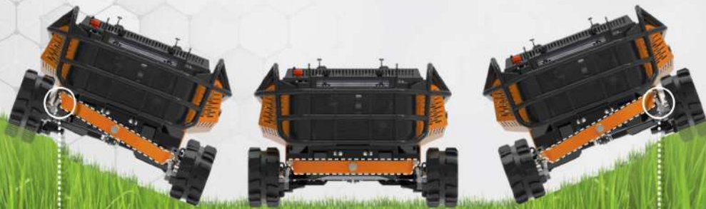
OSCILLAZIONE A SINISTRA LEFT SIDE OSCILLATION

RoboMINI grazie alla sua particolare concezione progettuale: baricentro basso e movimento oscillante dei cingoli , è perfetto per operare in zone sconnesse o su pendii ripidi, mantenendo sempre un ottimo grip in quanto la macchina resta sempre a contatto con la superficie anche in condizioni difficili.