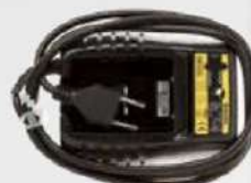
CARICABATTERIE DA 220V 220 V BATTERY CHARGER (OPTIONAL)