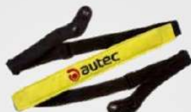
CINGHIA A TRACOLLA SHOULDER HARNESS (OPTIONAL)