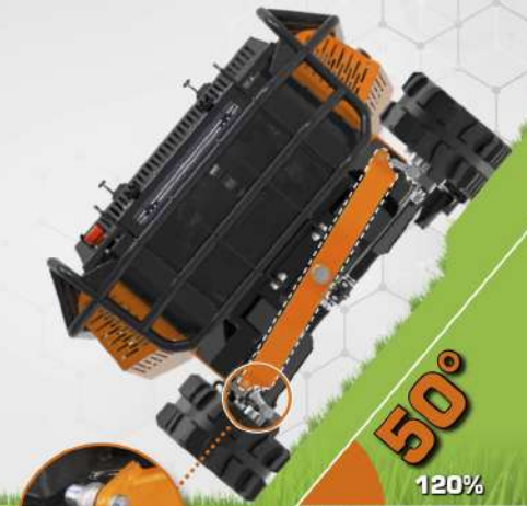
SINODO OSCILLANTE REGOLABILE ADJUSTABLE OSCILLATING JOINT